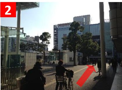
2 階段を降りたら、右手の出口からルフロン(ヨドバシカメラさんのビル)方面へ。