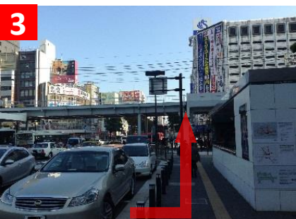
3 横断歩道を渡り左折。さいか屋へ向かって直進し、交差点を通過します。