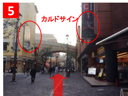
5 直進すると右手にスロットPIAさんとイタリアンのサルヴァトーレさんがいます。カルドも同じビルです。