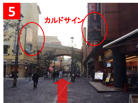
5 直進すると右手にスロットPIAさんとイタリアンのサルヴァトーレさんがあります。カルドも同じビルです。