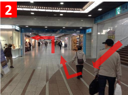
2 階段を降りて、アゼリア地下街に入ったら右折。突き当りを左折し、36番出口まで直進。