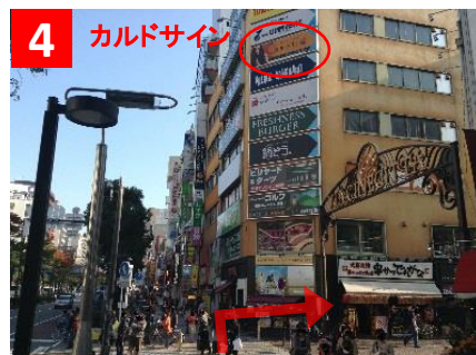
4 地上に出たら直進。右手に「ラチッタデッラ」の入口が見えるので右折。